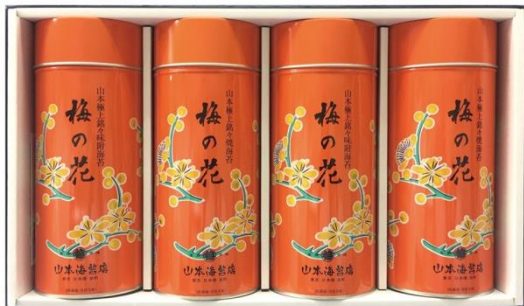
<山本海苔店>極上銘々海苔 梅の花詰合せ (2万円相当 25名様)