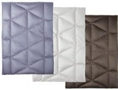
<日本橋西川>羽毛掛けふとん(シングル 1.2kg) (10万円相当 3名様)

メトロリンク日本橋(Eライン)の協賛企業・店舗より、豪華景品の数々をご用意しました。