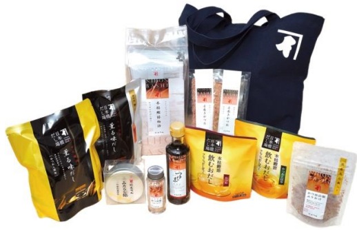
<にんべん>日本橋キャンペーンにんべんセット (1万円相当 50名様)