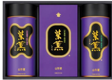
<山形屋海苔店>極上紫薫海苔詰合せ (1万円相当 45名様)

このほかにも、日本橋高島屋 S.C.・日本橋三越本店の商品券 10 万円分 (各 1 名様) に、下記施設の商品券・お食事券・ギフト券・宿泊券・観劇鑑賞券・招待券など多数ご用意。