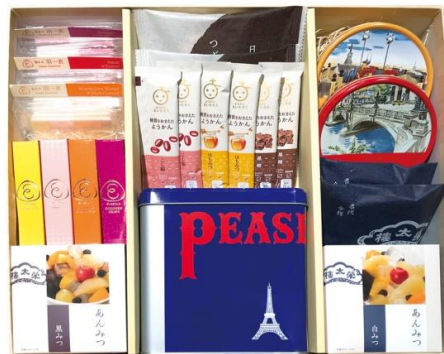
<榮太樓總本舗>代表銘菓詰合せ (1万円相当 50名様)