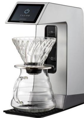
<HARIO>V60 オートプアオーバーSmart7BT (7万円相当 3名様)