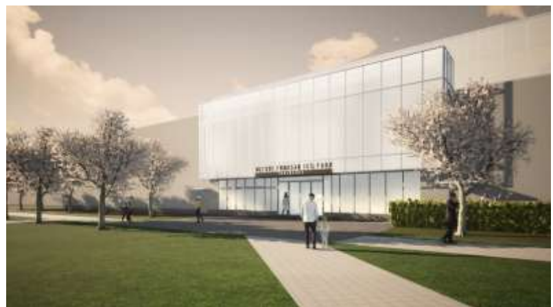
施設イメージパース