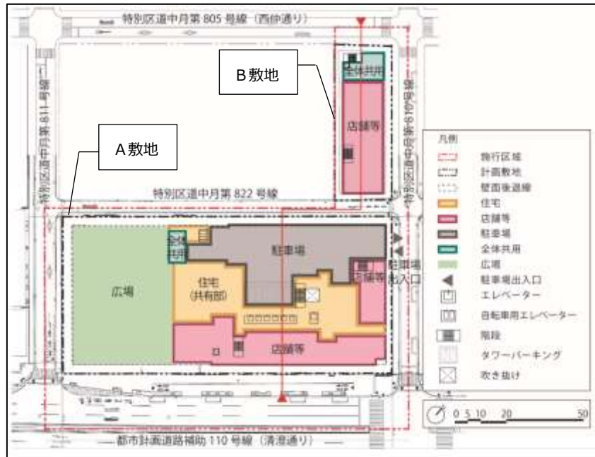
【配置図兼 1 階平面図】