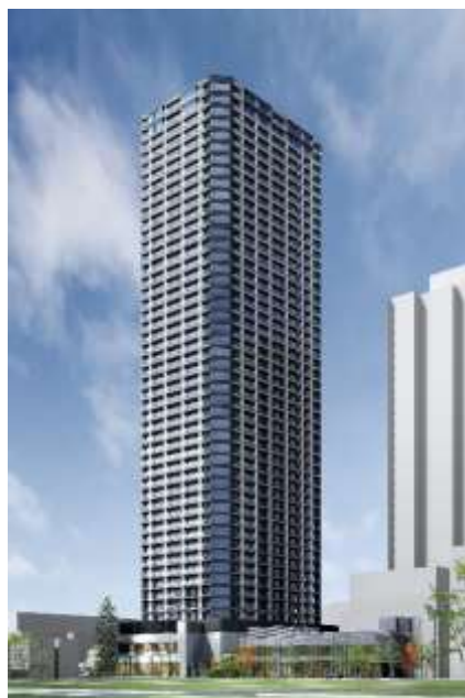
【建物外観完成予想CG】

今後も、権利者の皆様とともに、2026年度の竣工を目指し事業を推進してまいります。