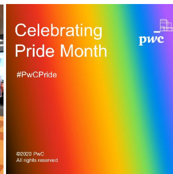
おうちでプライド@PwC Japan へのメッセージ投稿

私にとっての“Be yourself. Be different.”とは？ What is “Be yourself. Be different.” for you? 自分と違う他者を認め、受け入れること To respect and accept others who are different from me Be yourself. Be different.とは？ 自分の可能性を最大化すること。 その素晴らしいことに前向きで挑戦する人達を応援すること。 応援するうち、自分が成長をもちつづけることに気付くこと。 人間力の強さと力強さに気付くことにより、成長できること。 この成長が、自分たちと次世代の未来を明るくすること。 だから、未来を信じること。 私にとっての“Be yourself. Be different.”とは？ What is “Be yourself. Be different.” for you? 自分の素直な気持ちを受け入れること 「これが普通」というのが無くなること