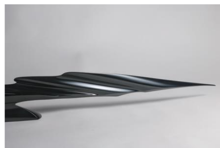
井川健「波の断片Ⅶ」2020年