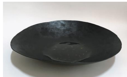
永守紋子「透き通った空気」2019年 40×40×10 cm／漆、顔料、麻布

2020 個展 「しばらくすると夜が来た」 (art space morgenrot)