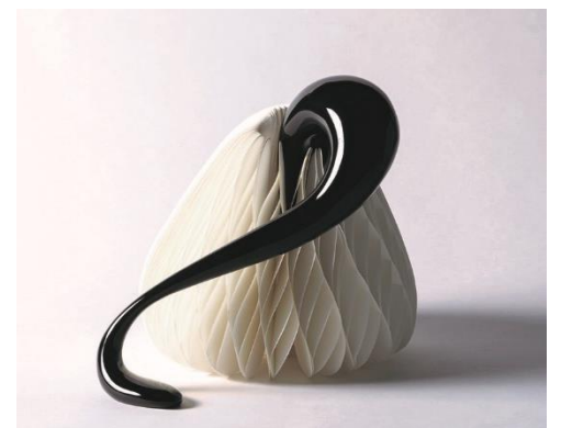
柘磨祥子「Symbiosis」2019年 27×32×29 cm/漆、麻布、紙