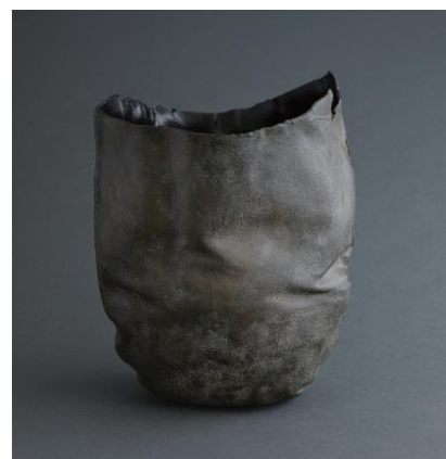
市川陽子「漆皮」2020年(参考作品)