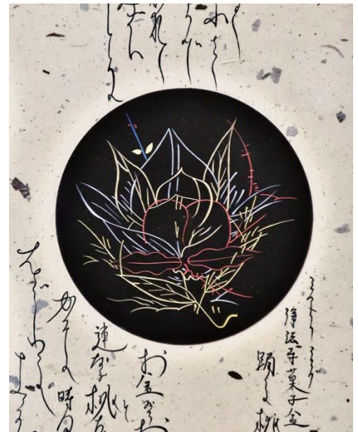
染谷聡「ミストレーシング/浄法寺菓子盆/踊る桃」2020年 平面作品・平皿・箱の一式[画像は平面作品(部分)]/漆、漆器 (古物)、木、StareReap2.5(RICOHによるUVインクの立体版画)