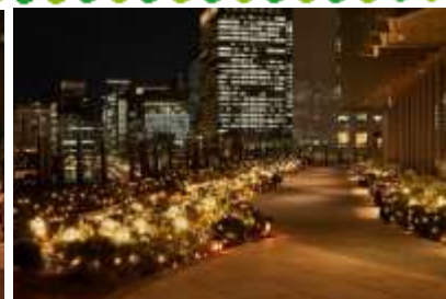
(左) 1階広場「HIBIYA & HOPE CHRISTMAS SQUARE」 (右)「PARK VIEW WINTER GARDEN」

今年はイルミネーションでロマンチックな気分になり、家でもクリスマス気分になる「おうちクリスマス」を取り入れたい!と考えている方も多いのでは?東京ミッドタウン日比谷では、そんな皆様の「おうちクリスマス」が“少し贅沢に”、そして“ひと味違った”時間になるような商品を多数取り揃えております。今回はその中でも更に厳選し、各店舗のスタッフが本気でおすすめするイチ押し商品をご紹介します!