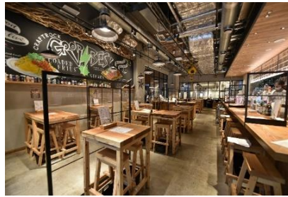
CRAFTROCK BREWPUB & LIVE (COREDO 室町テラス)