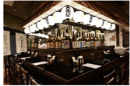
大金星 (COREDO 室町テラス)