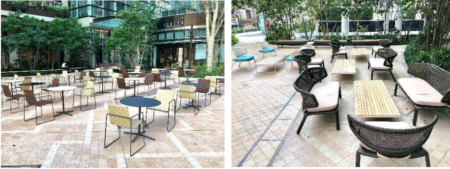
COREDO 室町テラス 大屋根広場