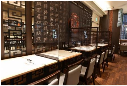
四川飯店 日本橋 ～Chen Kenichi's China～ (COREDO 室町 1)