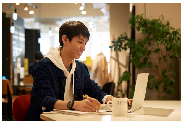
オンラインなら時間も場所も自由

スマートスタディⅡの内容に加えて、専門性の高い 3 つのプライムコンテンツ(①特別進学、②グローバル、③プログラミング)から 1 つを選択することが可能です。それぞれのコンテンツによって、より高い専門性を身につけ、自分の得意を最大化していくためのコースです。