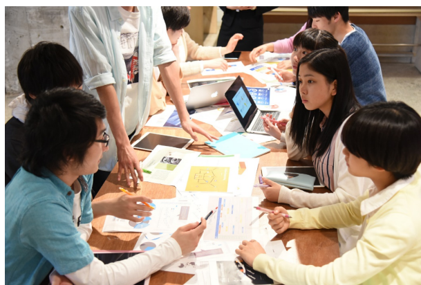
対面での授業も充実