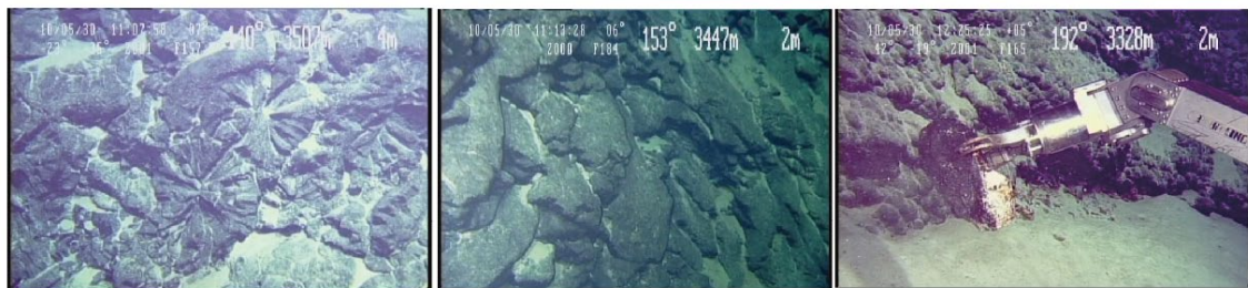
図 3. 有人潜水調査船「しんかい 6500」により撮影された海底の様子。マグマが海底を流出する際に作られる枕状溶岩が確認された。