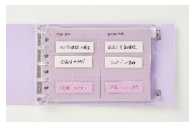
インデックスとふせんで 日々のタスクを管理