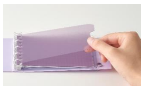
透明感のあるシースルーな インデックス

INTO-ONE+にはトレンドのシースルーカラーのインデックスが3山付属しています。検索や整理はもちろん、付箋の台紙として使うことで、TODOやタスク管理としても使うことができます。下敷きとしても活用でき、場所を選ばず書き込みができます。そのほか、小物の収納に便利なファスナー付きポケットリーフも付属。