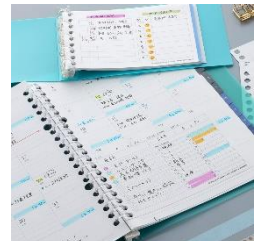
スケジュール管理