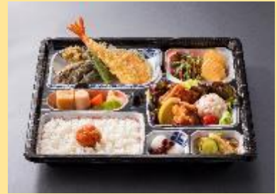
(左から順に)北海道豚ロース焼き弁当 / さばの味噌煮弁当 / 天ぷら弁当 4,200円(税別)⇒1,080円(税別)