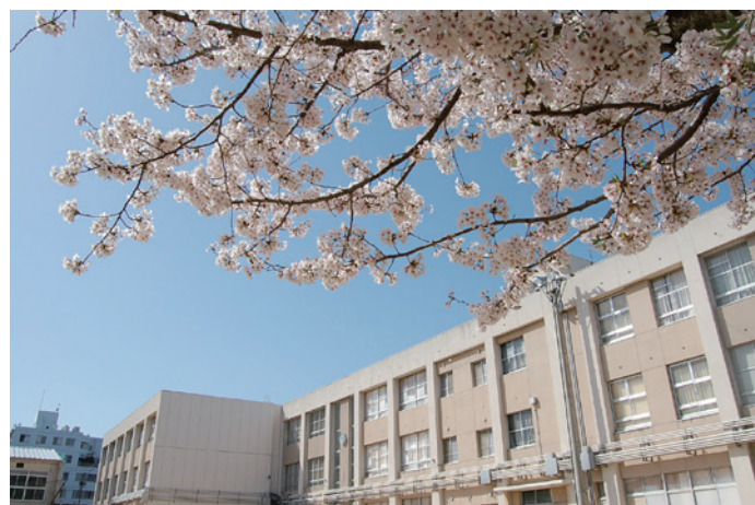
高松市総合教育センター

高松市は、平成30年度から令和5年度までの6年間を計画期間とする「第1期高松市ICT教育推進計画」を策定し、主体的、対話的で深い学びの実現に向けた授業改善を推進しており、タブレット端末等のICT機器を活用した授業改善や学習活動の充実に取り組まれています。新型コロナウイルス感染症拡大に伴い前倒しされたGIGAスクール構想に基づき、市内小・中学校における児童・生徒用合計約34,000台のWindows端末を整備することとなり、端末のセキュリティ対策として、「i-FILTER@Cloud」GIGAスクール版が採用されました。