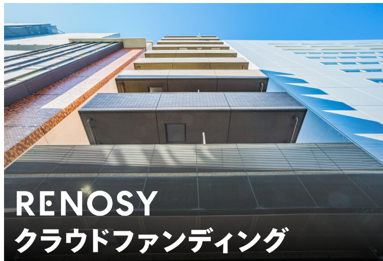
<「RENOSY クラウドファンディング キャピタル重視型 第23号ファンド」>