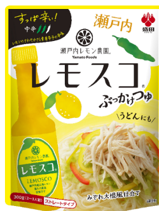
レモスコぶっかけつゆ