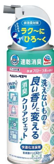
ヘルパータスケ 洗えないものを良い香りに変える 消臭クリアジェット

アース製薬株式会社(本社:東京都千代田区、社長:川端克宜、以下「アース製薬」)は、介護で頑張る人を応援する介護用品ブランド「ヘルパータスケ」から、壁紙や車のシートなど、洗えないものにしみついた排泄臭にスプレーするだけで消臭ができる『ヘルパータスケ 洗えないものを良い香りに変える 消臭クリアジェット』を、2月22日より全国で発売いたします。