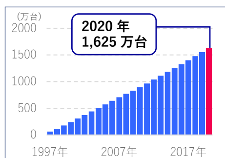
「音声ボイスリモコン」累計販売台数 ※詳細は3ページにて。

ノーリツを象徴する一つの存在が、一度は聞いたことがあるかもしれない、あのお風呂が沸いた時のメロディ。この「幸せのスイッチ」が誕生したのは1997年です。そこから遡った46年前に風呂釜の製造を開始した時から、ノーリツはずっと“お風呂で人を幸せにする”ことを考え続けてきました。