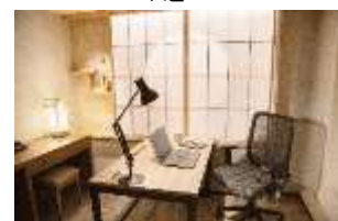
三井ガーデンホテル京都駅前 個室ワークスペース