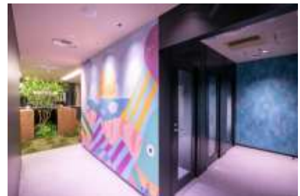
ワークスタイリング SOLO (ワークスタイリング SOLO 新百合ヶ丘)