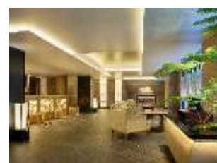
三井ガーデンホテル京都駅前 ロビー