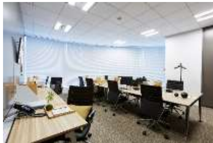
ワークスタイリング FLEX (ワークスタイリング東京ミッドタウン日比谷)