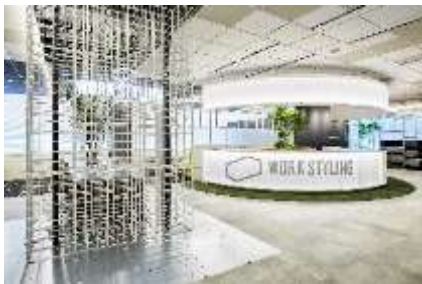
ワークスタイリング SHARE (ワークスタイリング六本木一丁目)

※ ワークスタイリング公式ホームページ: https://mf.workstyling.jp/