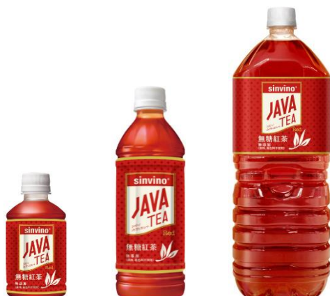
レッド ペットボトル