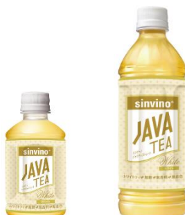
ホワイト ペットボトル