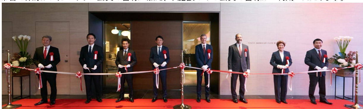
オープニングセレモニー テープカットの様子

本施設は会員制クラブであり、創立93年の伝統ある東京アメリカンクラブ初のサテライト施設です。従来の麻布台の東京アメリカンクラブ会員の皆様に加え、本施設のみの方の会員の皆様にご利用いただけます。