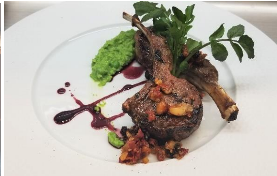
メニュー例:ラムチョップ