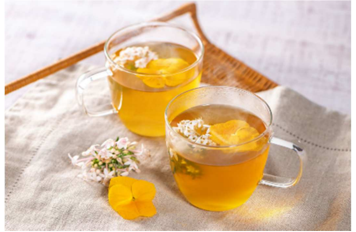
ドリンクの一例 ※イメージ