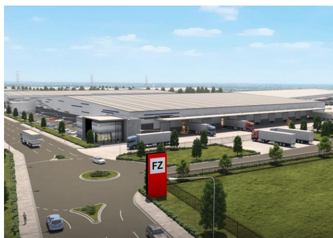
物件完成予想パース(第1期部分)