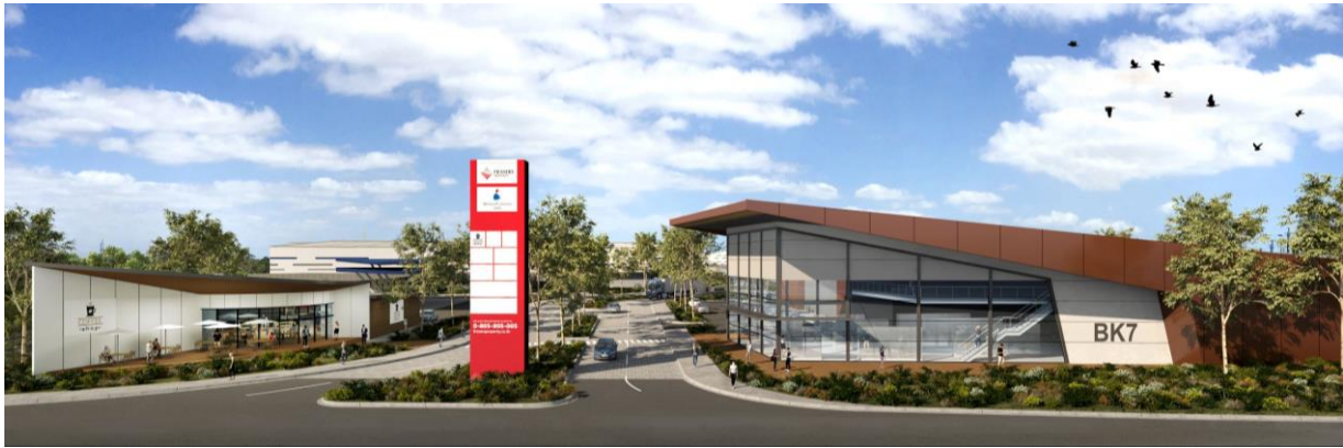
敷地入口部分予想パース