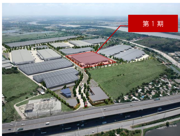
物件完成予想パース(全敷地)

当社グループは、これまで国内で培ってきた物流施設開発のノウハウを最大限に活かし、フレイザーズと共同で本事業を推進してまいります。