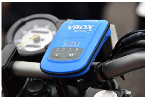
車両に取り付ける計測装置（VBOX）

終日レッスンを行う「オンロードレッスン」のほか、公道走行の体験ができる「オンロードレッスン&ツーリング」、オフロードコースで開催する「オフロードレッスン」、バイクの仲間づくりにも一役買っていると好評の女性限定・若者限定レッスンを行っています。なお「YRFS」を導入する「オンロードレッスン」の日程は下記の予定です。