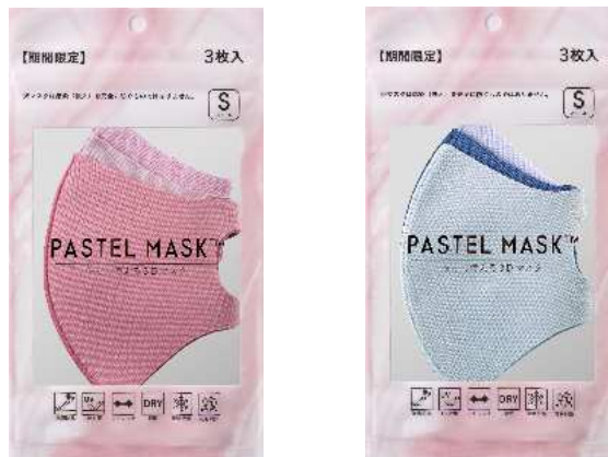
▲春夏の限定アソート

春夏の限定アソート「チェリーピンクアソート」「スカイブルーアソート」が 4 月中旬に限定発売。やさしい桜色をイメージした限定パッケージで、絶妙なカラーのピンク系、ブルー系を展開、CM 内でみちよばも着用しています。