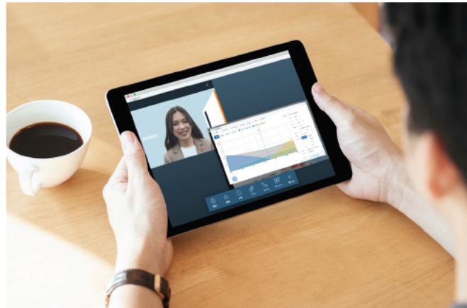
<オンラインでの投資コンサルティングイメージ>