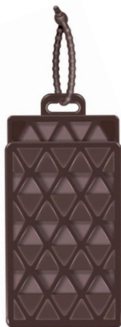
虫よけマモリーネ