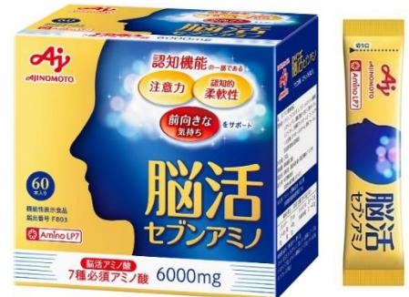
「脳活セブンアミノ」60本入り (約30日分)

日本では、超高齢社会を迎え、加齢に伴う認知機能の低下が大きな社会問題となっています。認知機能を維持・向上させることは生活の質の維持・向上に役立つとともに、医療や介護といった社会全体の負荷軽減の観点からも重要です。認知機能サポートサプリメントの国内市場規模は約170億円で ※5 、今後さらなる高齢化の進展により、市場規模がさらに拡大することが見込まれます。