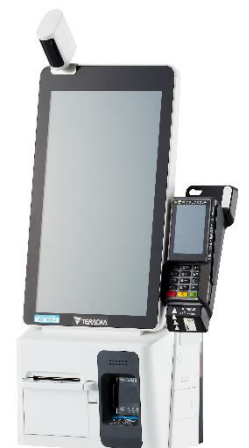
▲キャッシュレス専用機（本体）

これまで現金志向の強かった日本ですが、政府がキャッシュレス決済を推進したこと、さらに新型コロナウイルス感染拡大により非接触の支払い方法として、レジ精算におけるキャッシュレス化の需要は拡大しています。「HappySelf (G3)」は、電子マネー・クレジットカードに対応したマルチ決済端末 Verifone と連携することでキャッシュレス専用機としてご使用いただけます。本体の省スペース化により、当社製品では初めての壁掛けタイプや、現金対応レジの背面スペースに設置したツインタイプなど様々な設置バリエーションを実現。店舗の状況に応じた組み合わせが可能です。