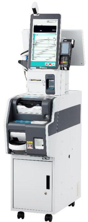
▲対面セルフタイプ Web3800T