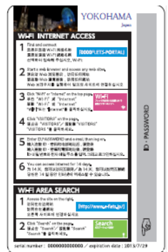
横浜版フリーWi-Fi「ID/PASSカード」