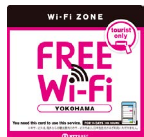
上記ステッカーのある店舗・施設で利用可能