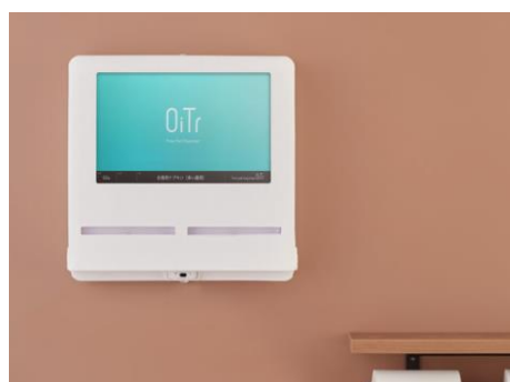
生理用ナプキンが常備されている ディスペンサー