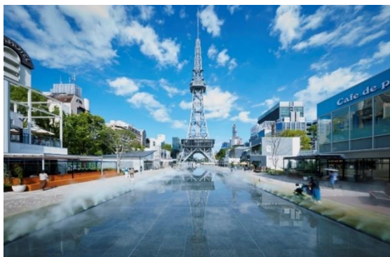
Hisaya-odori Park 外観