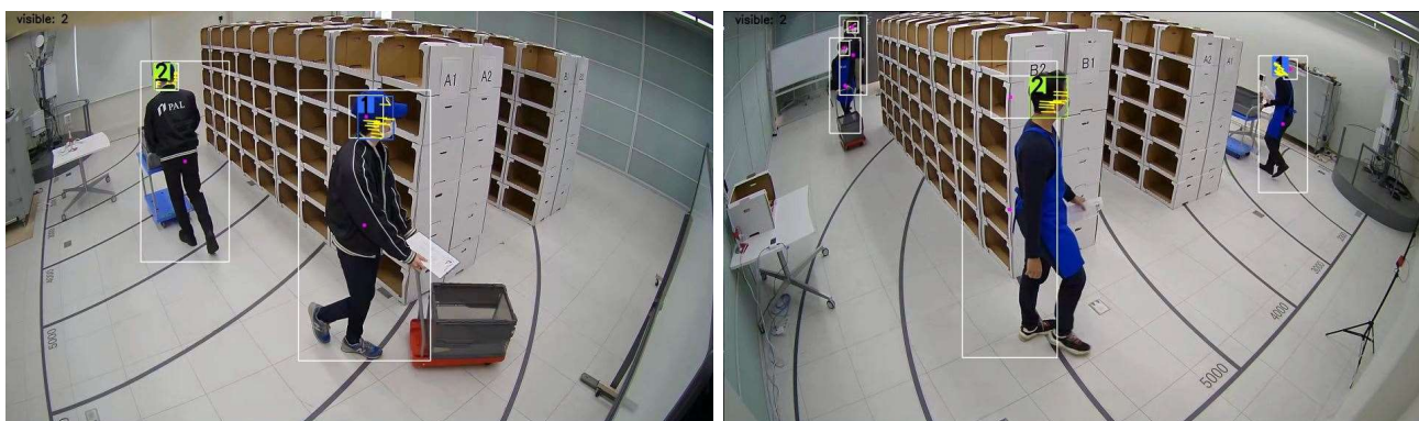
実際の人物の特定・検知