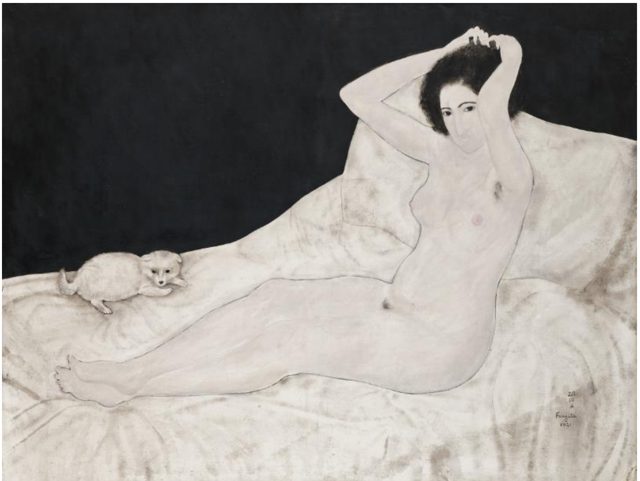
レオナルド・フジタ 《ベッドの上の裸婦と犬》 1921年 油彩/カンヴァス 89 x 116 cm ポーラ美術館

ポーラ美術館（神奈川県・箱根町）は、レオナルド・フジタの最初期の裸婦像《ベッドの上の裸婦と犬》を新たなコレクションに加えることとなりました。この新収蔵作品は、4月17日(土)から開催中の「フジタ-色彩への旅」展にて公開中です。既に収蔵しておりましたフジタ作品と合わせて計 215 点（油彩画 168 点、水彩画類 28 点、挿絵本 17 点、版画集 1 点、立体物 1 点）の日本最大級のフジタ・コレクションを有することとなります。