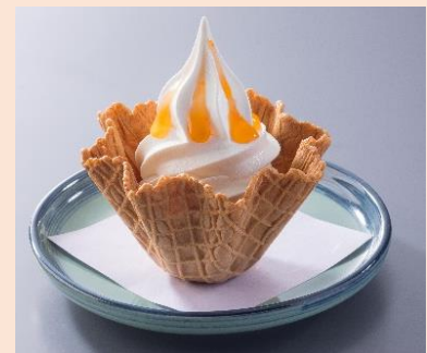
北海道牛乳ソフト 北海道メロンソーストッピング 390円(税込429円)