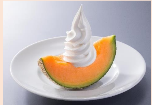
北海道メロンソフト 780円(税込858円)

北海道メロン綿雪ジャンボ 〈北海道牛乳ソフトトッピング〉 1,760円(税込1,936円) 〈トッピング無し〉 1,600円(税込1,760円)