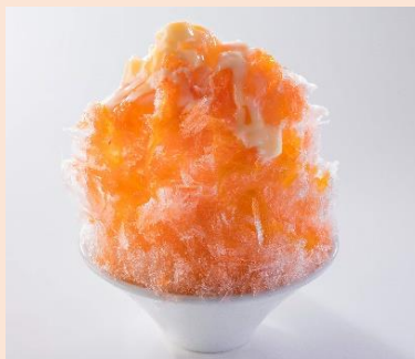
北海道 赤肉メロン綿雪 590円(税込649円) ※こちらは既に販売中です。