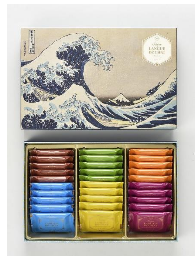
▲サク アソート 30枚入(葛飾北斎 富嶽三十六景 神奈川沖浪裏パッケージ) 3,780円