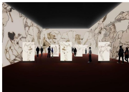
▲@Atelier Tsuyoshi Tane Architects

■掲載時の一般の方のお問い合わせ先■ 東京ミッドタウン・コールセンター TEL : 03-3475-3100