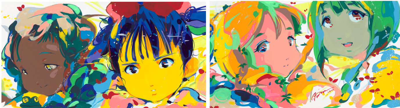
部分拡大イメージ

本プロジェクトに関するお問合せ：108 ART PROJECT 事務局（株式会社山下PMC内） info@108art.ne.jp