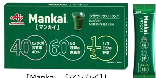
「Mankai ® [マンカイ]」 30本入り(約30日分)

※3) スティック1本当たり、厚生労働省が推進する「健康21」において1日分の野菜目標摂取量350gの1/3にあたる、約117g分の葉野菜マンカイ(ウォルフィア)を乾燥させた原料を使用しています。