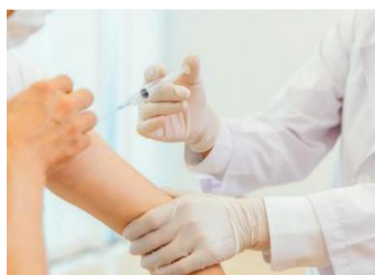
職域接種の開始 (阿蘇くまもと空港)

施設従業員の検温、マスク着用、手洗い・うがいの励行 館内・店舗での換気の実施、接触頻度の多い箇所の除菌 一部飲食店舗におけるテイクアウト・デリバリーの実施・推奨 お客様の来館前の体調チェック・マスク着用・手指アルコール消毒液のご利用のお願い キャッシュレス決済推進