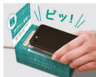
キャッシュレス決済推進 (三井アウトレットパーク等)