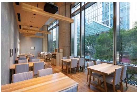
わたす日本橋 内観

今般、ともに災害を経験した熊本県と宮城県をつなぐ本ツアーの企画主旨に賛同し、ツアーご参加者へプレゼントを提供させていただきます。「わたす日本橋」はこれからも、人々の心をつなぐ架け橋となり、たくさんの笑顔とつながりが生まれる取り組みを続けてまいります。