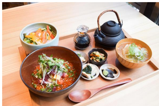
東北の食材を使用したメニュー例