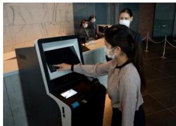
自動チェックイン機導入 (三井ガーデンホテルズ)