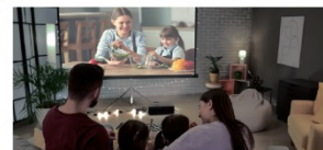
ホームシアターに