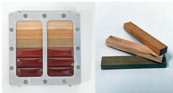
図1 曝露を計画している木材試験体

数種類の木材試験体(図1)を国際宇宙ステーション(ISS)「きぼう」日本実験棟の船外曝露プラットフォーム(図2)上で宇宙空間に曝露します。約半年後に回収し地上で物性試験や顕微鏡での組織構造観察、X線による結晶構造解析をします。宇宙のような極限環境での木材劣化の有無や状況、メカニズムの解明に取組みます。ここで得た知見から宇宙空間での木材の劣化予測や対策を検討します。