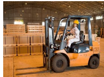
フォークリフトを使った業務風景

株式会社テクノ・サービス あんしん資格取得キャンペーン係: ts_shikakucampaign@techno-service.co.jp