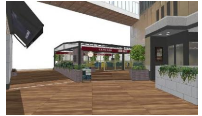
＜ルミネパサージュ＞

本年7月に改装し、緑溢れる居心地のよい空間となった屋外スペース「ルミネパサージュ」にて、H.P.FRANCE がセレクトする雑貨を中心に、MADE IN JAPAN の商品が並びます。特に、今回は若手クリエイターがひとつずつ手作業で作った1点ものの商品を多く取り揃えています。有楽町の夏を盛り上げ、ちよつとしたお祭り気分をお楽しみいただけます。