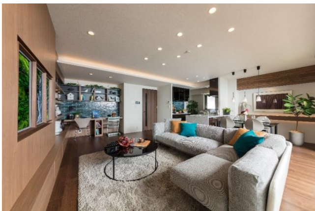
▲モデルルーム B-90I type<モデルルームプラン>写真