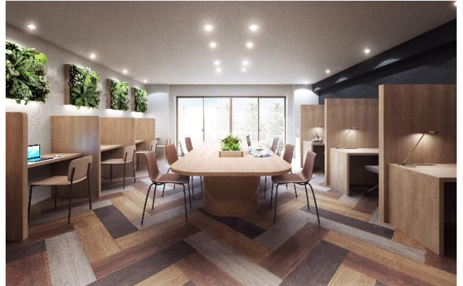
▶ ユーティリティラウンジ完成予想 CG

自宅、職場に次ぐサードプレイスとして、共用部には入居者が自由に使えるユーティリティラウンジを計画しております。テレワークやオンライン学習にも対応できる個別ブースや、読書や勉強スペースとして気軽に利用できるようなラージテーブルを設けております。