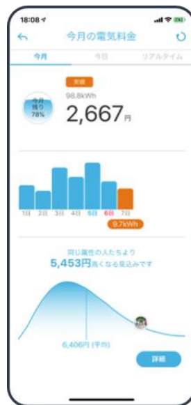
◀電気の見える化イメージ画面 ※5

また、HEMS でのエネルギー見える化による入居者の環境意識向上とともに、エネルギーセンターの供給を最適化させる CEMS との連携で省エネアドバイスによる環境活動の促進等、エリア全体の省エネ・省 CO 2 化を図っています。「みなとアクルス」では、2019 年 10 月～2020 年 9 月の期間で CO 2 削減率 65%(1990 年比)を実現していますが、本物件の竣工後には、さらなる CO 2 排出量削減に寄与してまいります。