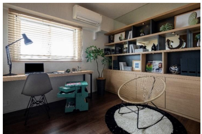
▲モデルルーム B-90I type<洋室>写真