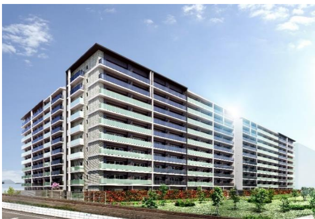
▲建物南西側 外観完成予想 CG