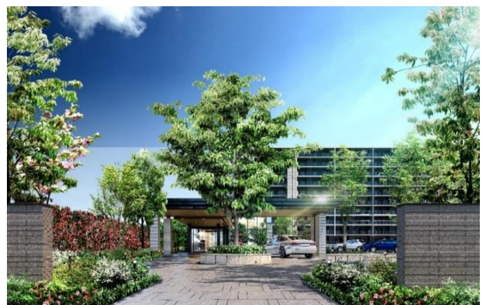
▲エントランスアプローチ 外観完成予想 CG