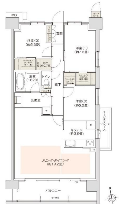
▶ B-90I type <モデルルームプラン> 専有面積：90.91 m 2 ※トランクルーム面積(0.40 m 2 )含む

解放感あるセンターオープンサッシの採用をはじめ、全戸トランクルームやファミリークロゼット、ウォークインクロゼット、納戸等豊富な収納スペースを設けており、家族の多様な暮らし方に寄り添う設計としています。販売予定価格は、2,790 万円~5,290 万円、最多販売予定価格帯は、3,700 万円台で、2021 年 11 月下旬の販売開始を予定しております。