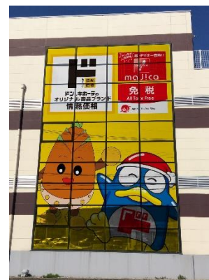
ドン・キホーテ合志店外観イメージ(左)、合志市のゆるキャラ『ヴィーブルくん』と当社の公式キャラクター『ドンペン』の店舗外観のガラス面イメージ(右)