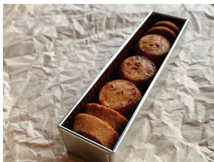
「エписサブレ(シングル缶)」イメージ