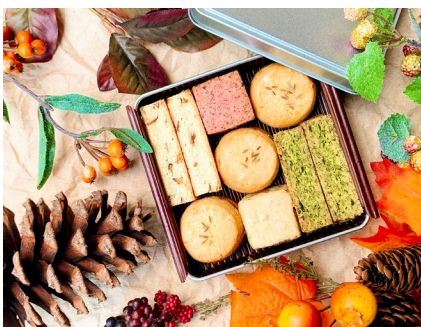
「エписサブレ(アソート缶)」イメージ

ご旅行とお土産のセットプランとしてはもちろん、お仕事終わりにサブレを味わいながら至福のひと時を過ごすのにも最適なプランです。