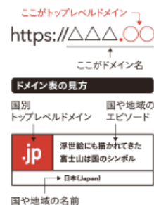
ポスター記載要素