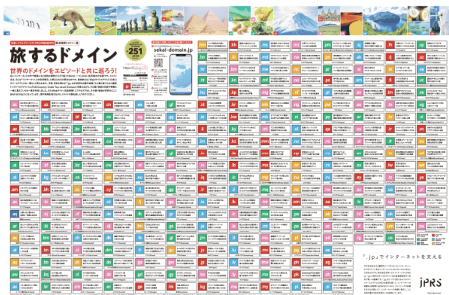
ポスターサンプル

いまや若年層においてもインターネットの利用は当たり前のこととなりましたが、その基盤を支えるドメイン名やDNSについて知る機会や、学ぶための教材は十分ではありません。今回配布するポスターは、ccTLD が割り当てられた国や地域の名前とエピソードを、ccTLD を表す2文字と共に掲載し、楽しみながら学べるものとなっています。