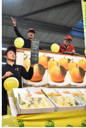
▲過去の市場解禁PRの様子

下記の通り、販売解禁PRを実施致します。 取材の際は、新型コロナウイルス感染拡大防止の徹底をよろしくお願い致します。