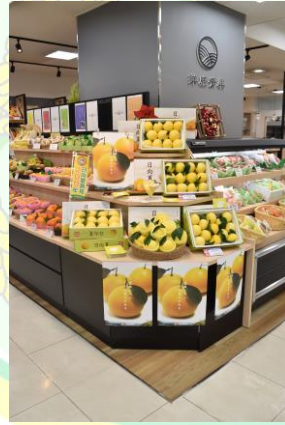
▲洋康青果様での販売の様子