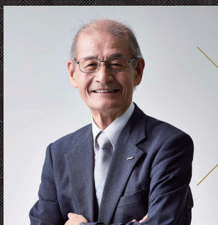
吉野 彰 名城大学終身教授