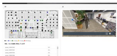
管理画面（人流リアルタイム）