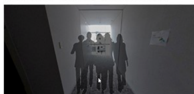
避難画面（昼間／出入口付近）