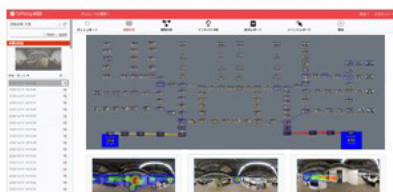
解析画面（人流・視線の合計）