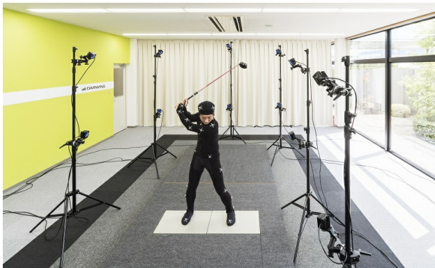
R & Dセンター