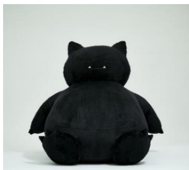
PLUSH (XL) —88,000 円(税込)

※掲載アイテムは一部アイテムとなります。写真はサンプルとなりますので実物と異なる場合がございます。