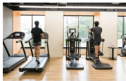
フィットネスなどパブリックスペースの人数制限と消毒の徹底