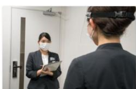
スタッフの体調管理の徹底