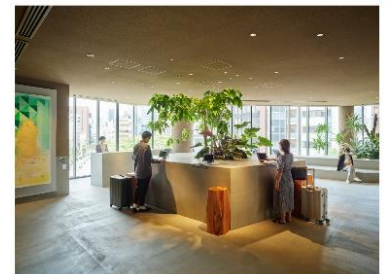
sequence MIYASHITA PARK (レセプション)