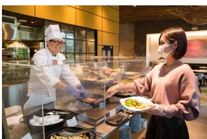
レストラン店内のアクリルボード設置とマスク・手袋着用徹底(ビュッフェ)