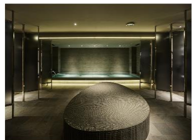
sequence KYOTO GOJO (THE BATH & THE SAUNA)