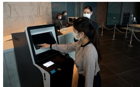
自動チェックイン機導入による接触軽減