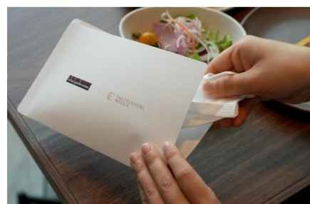
レストラン店内ではマスクケースをご用意