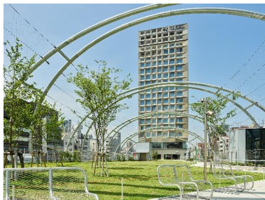
sequence MIYASHITA PARK (外観)