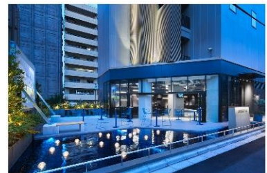
sequence SUIDOBASHI (外観・オープンテラス)