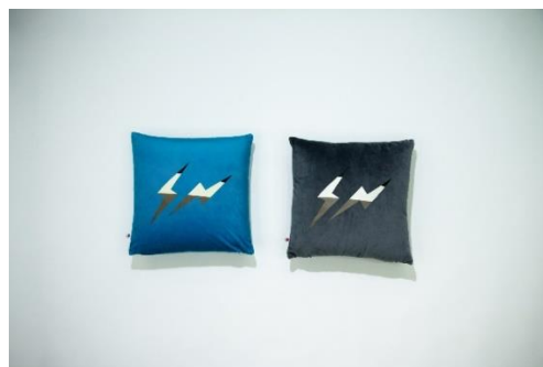
CUSHION—各 6,600 円(税込)