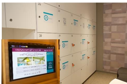
大浴場の利用制限と客室のテレビモニターで利用状況の確認