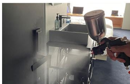
客室内の消毒と抗菌対策の徹底