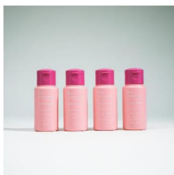
retaW のアメニティセット