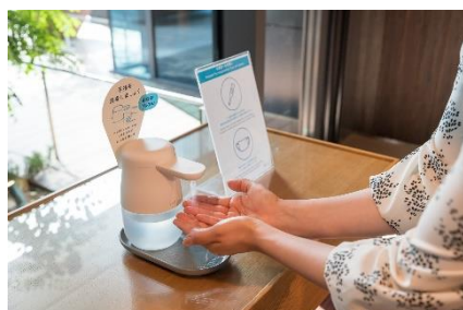
入館、館内施設利用時の検温と消毒